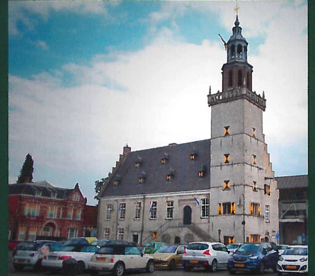
Uitgave gemeente Hulst - januari 2020