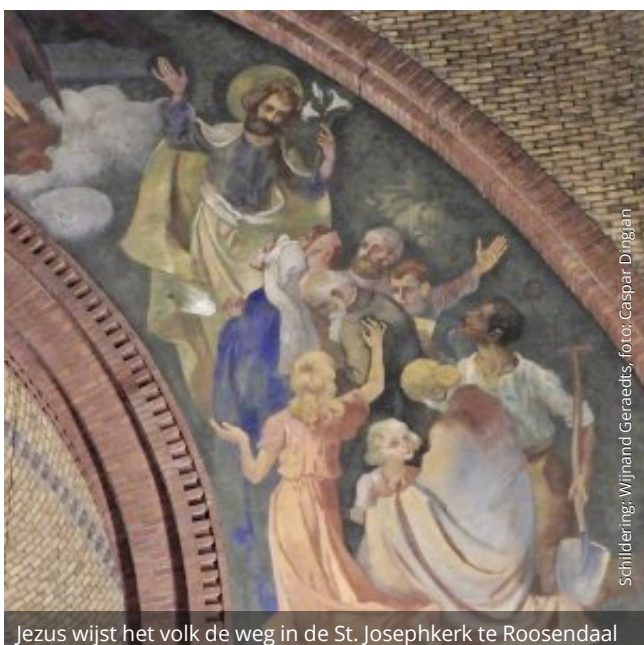
Jezus wijst het volk de weg in de St. Josephkerk te Roosendaal