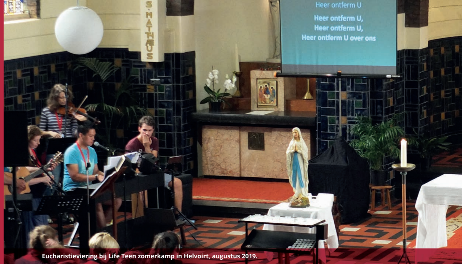
Eucharistieviering bij Life Teen zomerkamp in Helvoirt, augustus 2019.

In onze parochies is veel gaande de afgelopen jaren. Het aantal kinderen dat gedoopt, gevormd wordt en de eerste communie ontvangt neemt elk jaar af. Dat geldt ook voor de mensen die de weekendviering bezoeken. Op allerlei manieren proberen pastorale beroepskrachten en vrijwilligers het tij te keren maar het wordt steeds duidelijker dat we het niet moeten hebben van kleine impulsen.