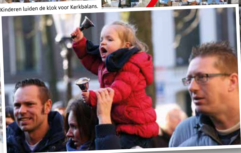
Kinderen luiden de klok voor Kerkbalans.

Jaarlijks halen 40.000 vrijwilligers in 2000 kerken in Nederland geld op voor hun plaatselijke kerk. Om kerken actief te laten zijn. Waar iedereen altijd terecht kan. Geef voor je kerk . Zodat jouw kerk kan geven aan anderen.