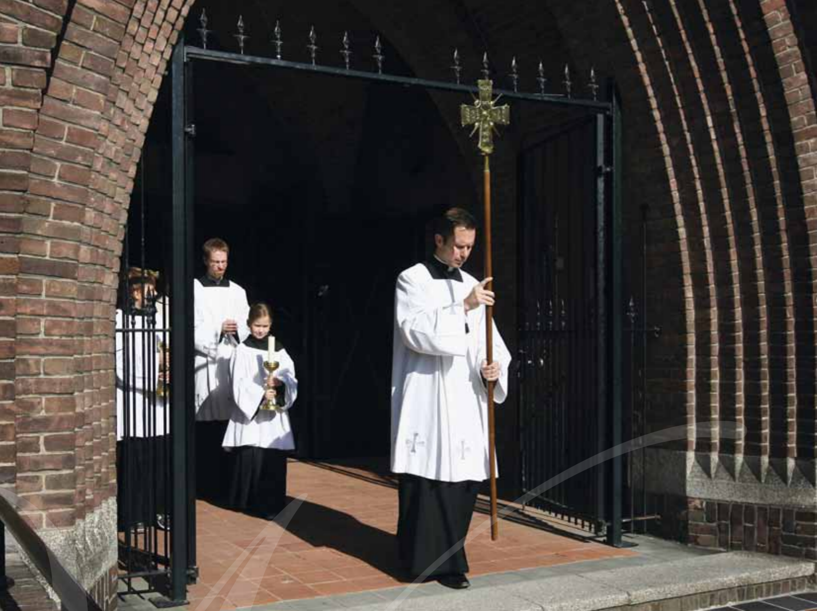
H. Johannes de Doperkerk, Hoeven.