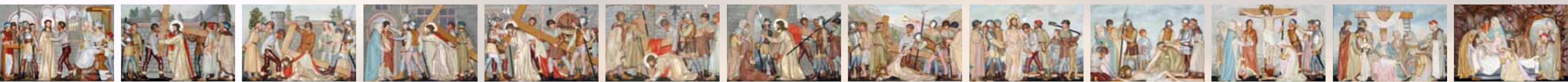
De kruisweg van Kwadendamme.

De kruisweg is een geliefde devotie binnen de Katholieke Kerk. In veertien staties gaat de gelovige de weg van het lijden van de Heer.