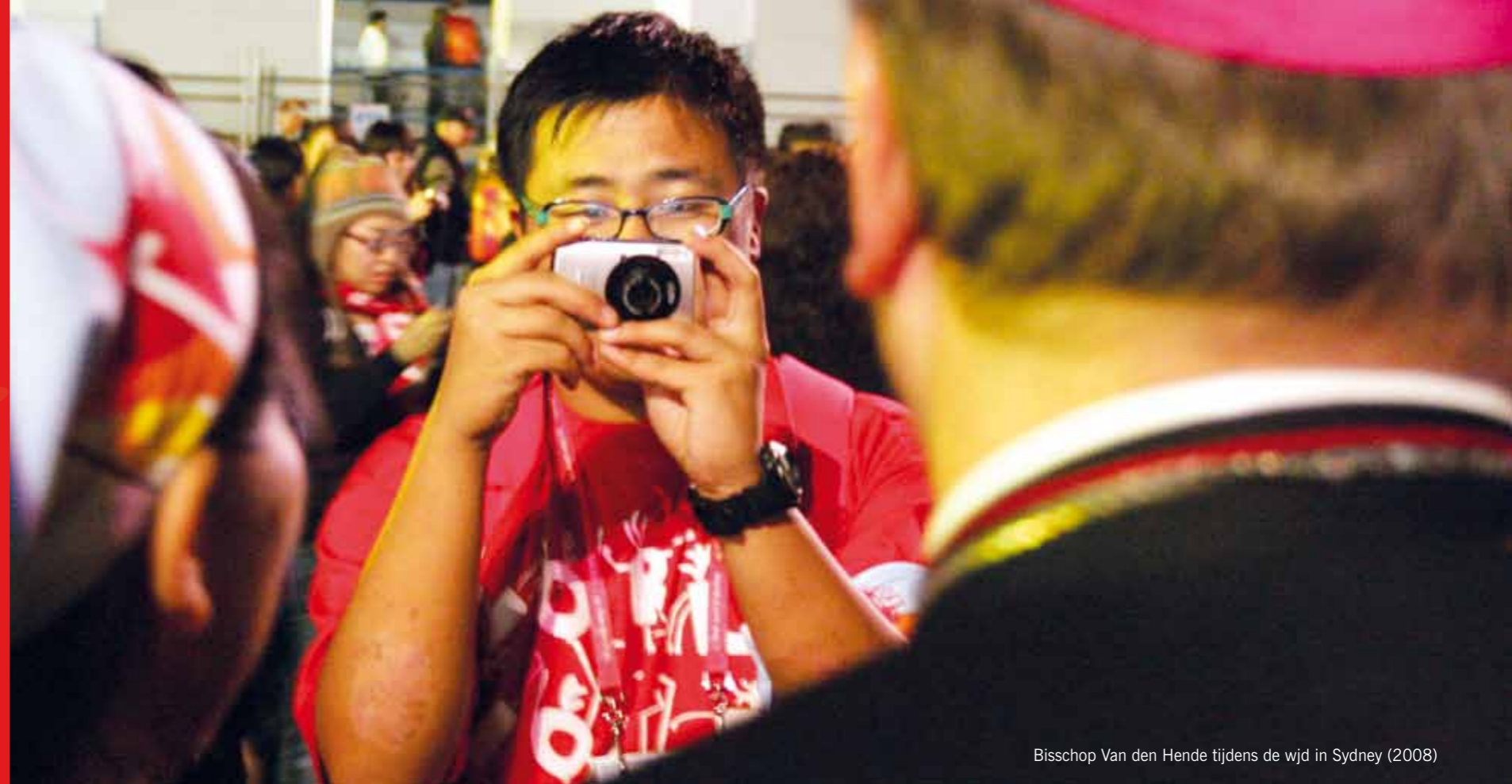
Bisschop Van den Hende tijdens de wjd in Sydney (2008)