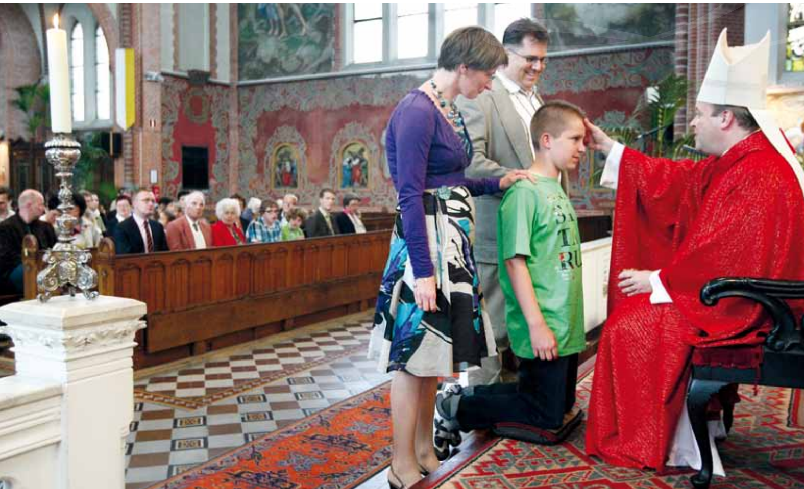
Vormselviering in Goes (19 juni 2010)

Bij het begin van het messiaanse optreden van Jezus wordt Hij door Johannes gedoopt in de Jordaan. De evangelisten vertellen dat meteen na die doop de heilige Geest op Jezus neerdaalde in de gedaante van een duif. Jezus zag zelf die duif op zich neerdalen (Mc. 1, 10) en ook Johannes de Doper getuigt dat Hij dit gebeuren met eigen ogen gezien heeft (Joh. 1, 32).