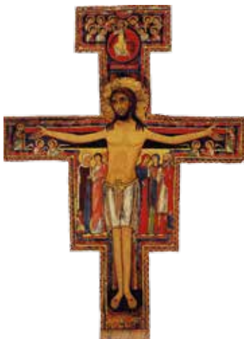
Het kruis van San Damiano.

De heilige Geest geeft hem het inzicht dat alles wat God geschapen heeft bij elkaar hoort en dat je daar goed voor moet zorgen. Zo wordt hij niet alleen de vriend van mensen, maar van alles wat God geschapen heeft. Daarom wordt zijn feestdag uitgeroepen tot Werelddierendag. Hij sterft op 3 oktober in 1226. Twee jaar later wordt hij heilig verklaard.